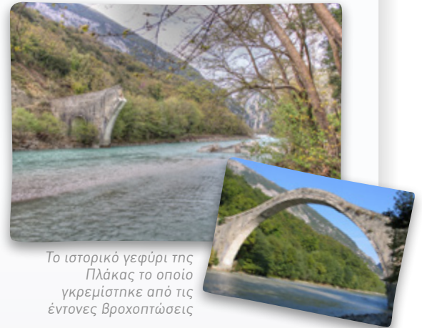
Το ιστορικό γεφύρι της Πλάκας το οποίο γκρεμίστηκε από τις έντονες βροχοπτώσεις

Είναι σημαντικό να θυμόμαστε ότι η ασφάλεια είναι το μοναδικό προϊόν στον κόσμο το οποίο αγοράζουμε όταν δεν το έχουμε ανάγκη, ενώ όταν το έχουμε ανάγκη δεν μπορούμε να το αγοράσουμε.